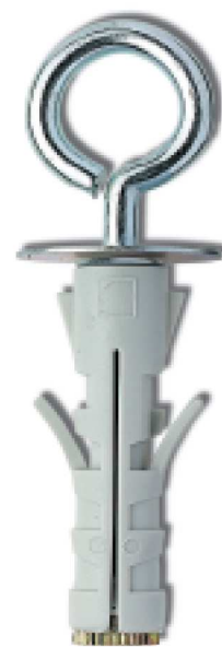
Versione con occhiolo chiuso zincocromato