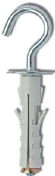
Versione con occhiolo aperto zincocromato