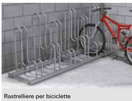
Rastrelliere per biciclette