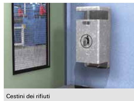
Cestini dei rifiuti