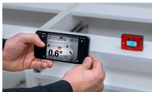
Foto con dati in tempo reale

Uno dei pratici strumenti dell'app è Foto-Overlay Export, che consente di fotografare la situazione di lavoro o di misurazione con il dispositivo mobile, visualizzando e salvando direttamente sulla foto dati in tempo reale come valore misurato, data e ora.